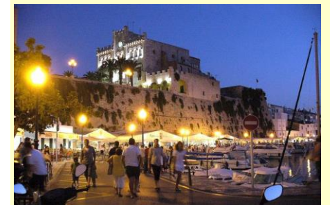
Ci-dessus Ciudadella by night