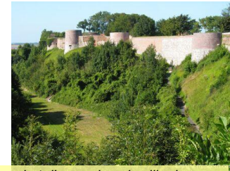
but d'excursion : la ville de Montreuil et ses remparts

En soirée Atelier carte Attention aux blocages