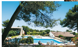
Parc aux oliviers centenaires