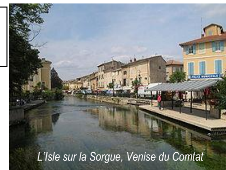
L'Isle sur la Sorgue, Venise du Comtat