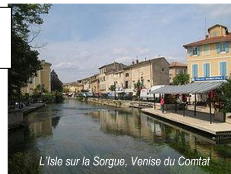
L'Isle sur la Sorgue, Venise du Comtat