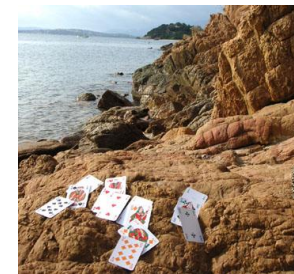
Excursion offerte aux calanques de Piana

entourée de la chaîne montagneuse enneigée jusqu'en mai, paysage unique. Route vers Notre Dame de la Serra où la vue sur le golfe de Calvi est absolument sublime. Continuation par la visite de la citadelle de Calvi. Fortifiée à la fin du XVe siècle, la citadelle enserme l'ancien palais des Gouverneurs, édifice du XIIe siècle.