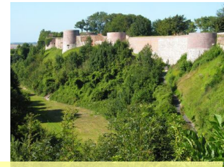
Un but d'excursion : la ville de Montreuil sur Mer