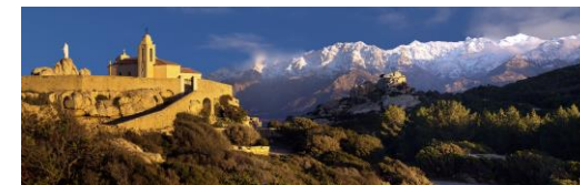
Calvi – Notre Dame de la Serra

16h30 : Tournoi SimultaNet, avec handicap,