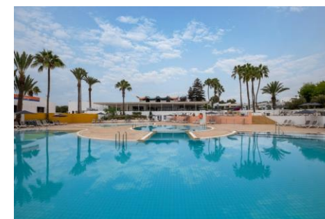
Hôtel Bravo Club Allegro, piscine chauffée en hiver

Excursion facultative vers Taroudant , la cité la plus pittoresque du sud marocain, où se cache la