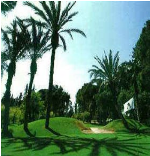
Les parcours de GOLF, un des principaux attraits de la destination

Cette station, quasiment européenne, est toujours attirante à cette période de l'année, où la plage immense reste bien souvent très ensoleillée, et où le ciel est d'un bleu