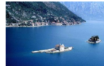
Bouches de Kotor

pour le Master, vainqueur du classement général, l'invitation au très prisé Week-End en Croisière / Finale des Masters.