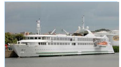
Le MS Belle de l'Adriatique, mini-paquebot ou gros yacht