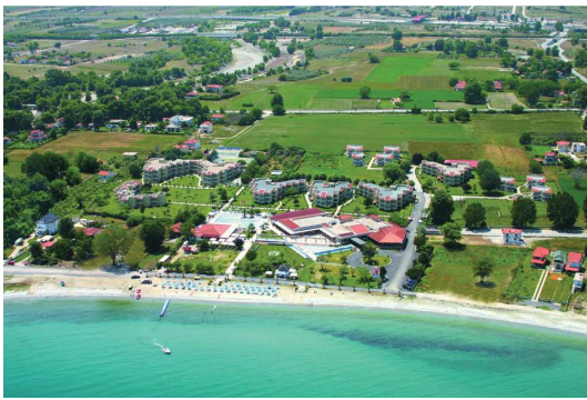
Un grand domaine, en bord de plage, abrite sept petits bâtiments de deux étages