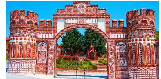
Le monastère de Dionysos