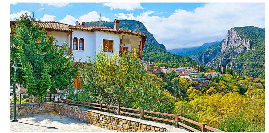
Sur la route du Mont Olympe

Retours sur la France, dont l'horaire nous aura été confirmé sur place.