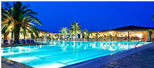
L'ordre des tournois et des sorties pourra être modifié pour s'adapter aux circonstances locales.

A proximité de sites grecs mythiques, comme le Mont Olympe, et les Météores, et néanmoins au calme, l'hôtel Poséidon Palace, bénéficie d'une situation exceptionnelle, au bord d'une longue plage. Avec le bridge, voilà des vacances dynamiques mais relaxantes. Yamas !