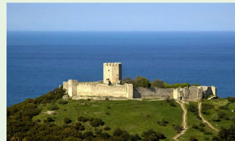
Château de Platamonas

Journée libre pour vous permettre une excursion longue 20 h 30. BRIDGE. Tournoi Mixte//Dames , joué sur Octopus .