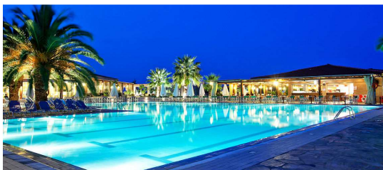
L'ordre des tournois et des sorties pourra être modifié pour s'adapter aux circonstances locales.

A proximité de sites grecs mythiques, comme le Mont Olympe, et les Météores, et néanmoins au calme, l'hôtel Poséidon Palace, bénéficie d'une situation exceptionnelle, au bord d'une longue plage. Avec le bridge, voilà des vacances dynamiques mais relaxantes. Yamas !