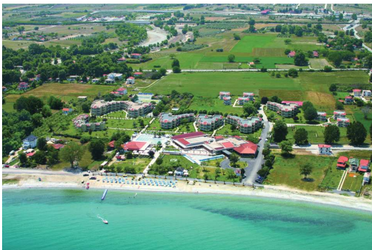
Un grand domaine, en bord de plage, abrite sept petits bâtiments de deux étages