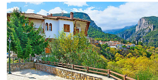
Sur la route du Mont Olympe

Encore une bonne partie de la journée à se détendre, le décollage vers Orly-Sud étant prévu en début de soirée.