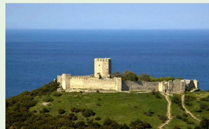
Château de Platamonas

Journée libre pour vous permettre une excursion longue 20 h 30. BRIDGE. Tournoi Mixte//Dames , joué sur Octopus