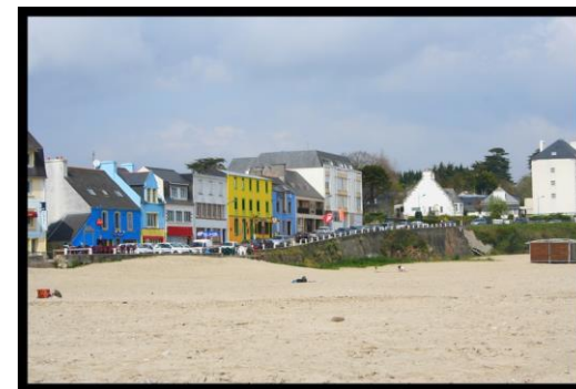
Morgat – le village