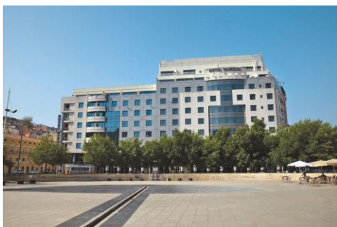
Le 4 étoiles le mieux situé de la ville