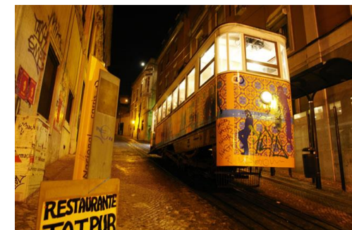
Spectaculaires tramways, à l'attaque des sept collines de la ville

Les horaires des tournois et des visites pourront être modifiés pour s'adapter aux circonstances