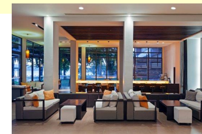
Salons du Longos Beach

Tous les tournois sont homologués FFB (Points d'expert) et comptent pour les As d'Or de Bridge International.