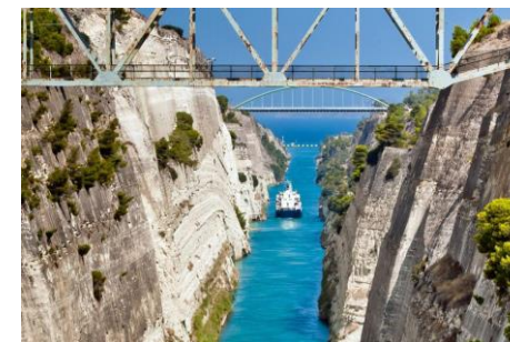
Canal de Corinthe