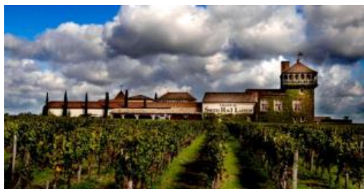
Château Smith Haut Lafitte

Un terroir de prestige. Une mosaïque de paysages, complexe en couleurs, textures et ambiances. Seul parcours des croisières en Aquitaine qui s'accommode d'un programme d'activités bridge. En profitant des temps de navigation, souvent en matinée, pour pratiquer toutes les formes de tournoi de Bridge sans rien perdre du paysage grâce au salon panoramique qui abritera nos joutes.