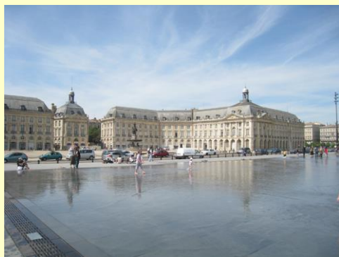
Bordeaux- Le Miroir d'eau

Le MS Cyrano de Bergerac totalise 87 cabines, nous n'en disposons que de 20, le reste du bateau est déjà réservé, les bridgeurs devront donc se manifester au plus tôt. Toutes les cabines donnent sur l'extérieur, avec grandes fenêtres et sont équipées de douche et WC, TV, sèche-cheveux, coffre-fort et radio. Salle à manger pouvant accueillir tous les passagers en un seul service. Excellente cuisine, à plusieurs reprises appréciée par les bridgeurs ... ! Longueur 110m, largeur : 11,40m. Un vrai bon confort, et bien sûr, pas de mal de mer à redouter ... !