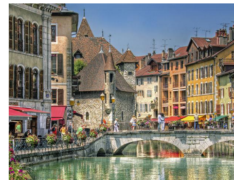
Pittoresque vieil Annecy

16h : Tournoi dans le cadre du Simultané