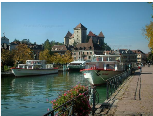
Devant l'hôtel, piste cyclable jusqu'à la vieille ville

Non seulement Championne de France en titre, mais aussi enseignante professionnelle et organisatrice dévouée, elle sait aussi cultiver la convivialité, chère aux Balades Bridge