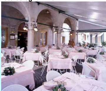
Ci-dessus le restaurant intérieur

Plus de détails sur notre site web et sur : www.hotelbologna.vr.it