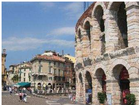
Près des arènes. l'hôtel Bologna (store vert)