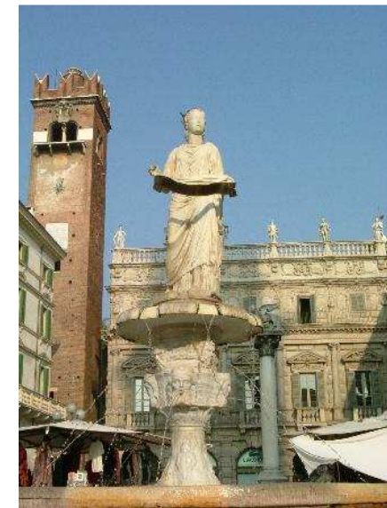
La fontaine Madonna di Verona

Matinée libre, pour détente, ou dernier shopping