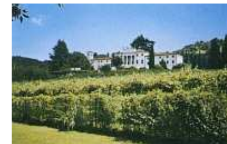
Villa del Bene - Valpolicella

Transfert à l'aéroport pour le vol de retour vers Paris-Roissy. (Décollage 17h.40 – arrivée 19h20).