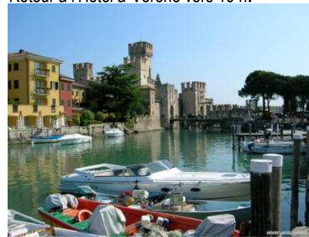
Sirmione sur le lac de Garde

17h. BRIDGE Tournoi SimultaNet , notre simultané « à l'international » avec l'avantage d'un livret-recueil des commentaires sur les huit meilleures donnes, par Daniel Tixier.