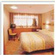
Cabines, toutes avec salle d'eau et grande fenêtre

Longueur 110m, largeur : 10m. Un vrai bon confort, et bien sûr, pas de mal de mer à redouter.