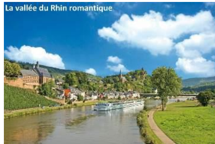
La vallée du Rhin romantique

Continuation de la croisière en direction de Koenigswinter. Escale de nuit. Soirée libre.