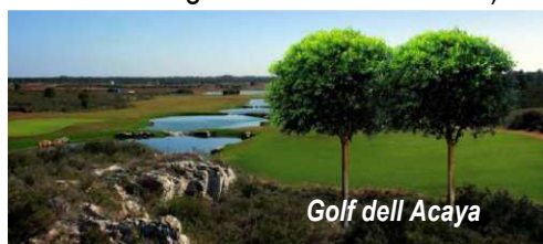
Golf dell Acaya

Une belle piscine extérieure, et un luxueux centre de Spa complètent la gamme de services offerts. Le restaurant propose une carte orientée sur les spécialités locales (à noter possibilité de repas sans gluten). Navette gratuite pour la plage de sable blanc (à 900m) A quelques kilomètres les amateurs de golf pourront exercer leurs talents à Dell'Acaya Golf Club (voiture nécessaire – green fees environ 40 €)