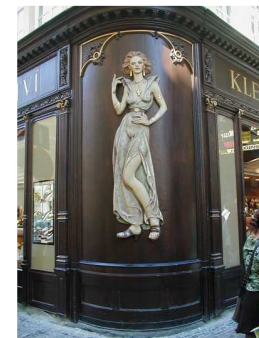
Témoignages harmonieux du style néo-renaissance et art nouveau