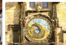
La fameuse horloge astronomique