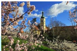
Prague au printemps