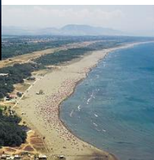
Ulcinj, la plage