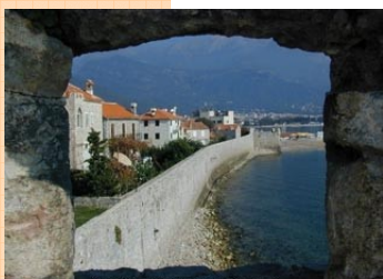
Budva, vieux cité fortifiée