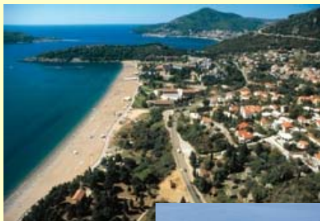
La plage de Becici, devant l'hôtel