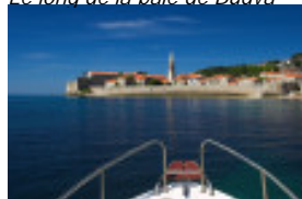
Le long de la baie de Budva