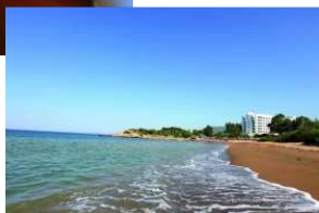
Longue plage de sable fin