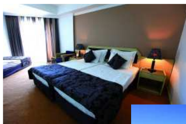
Chambres spacieuses avec balcon

Départs de Paris, Nantes, Lille, Lyon et Marseille