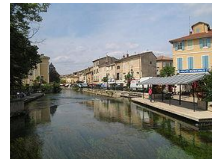
L'Isle sur la Sorgue, Venise du Comtat

C'est jour du marché provençal à l'Isle sur Sorgue, couleurs et parfums se répondent ... 14h30. Stage : Recherche du contrat à S-A