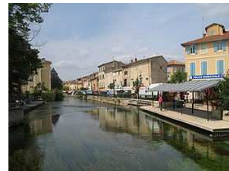
L'Isle sur la Sorgue, Venise du Comtat

Nombreuses activités à proximité : randonnées pédestres, golf, balade vers Fontaine de Vaucluse et sa fontaine d'où sourd la Sorgue 14h30. Stage : Enchères après Intervention