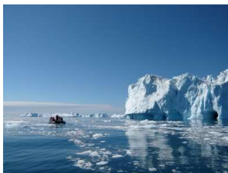
Baie de Disko

Craquements, détonations... Ecoutez la glace « chanter » ! Féérique.