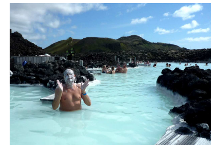
Le Lagon bleu à Reykjavik