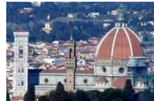
Santa Maria del Fiore

Il reste évidemment beaucoup à explorer : l'église de Santa Croce, le musée et la chapelle des Pazzi, les villas médicéennes, le palais et jardins Boboli, la pittoresque pharmacie du couvent Santa Maria de Novella, juste à côté de l'hôtel, etc.