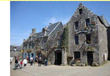
Un but d'excursion : Locronan