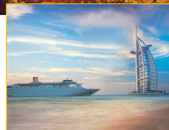
Dubaï. Burj el Arab