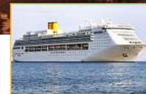
Costa Victoria un 4 étoiles sur mer