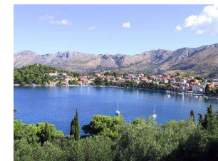
Cavtat depuis l'hôtel Croatia

Ou mieux : suite du séjour par une semaine balnéaire à Cavtat à côté de Dubrovnik :