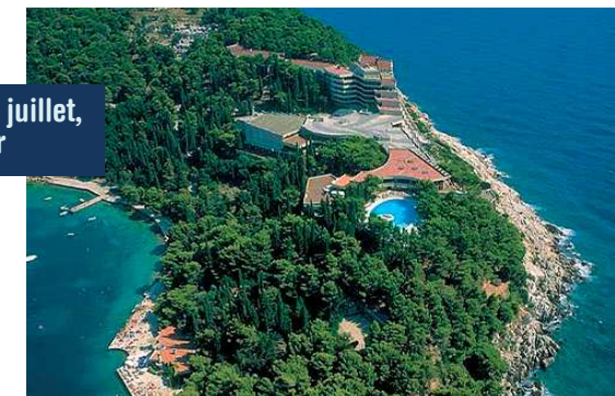
Continuation en séjour au Croatia**** réputé le plus bel hôtel de la région