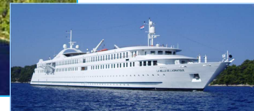
Le MS Belle de l'Adriatique