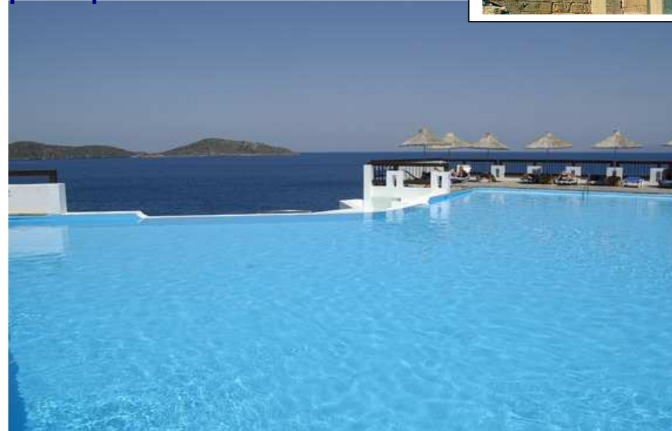
Hôtel-club Elounda Village*****