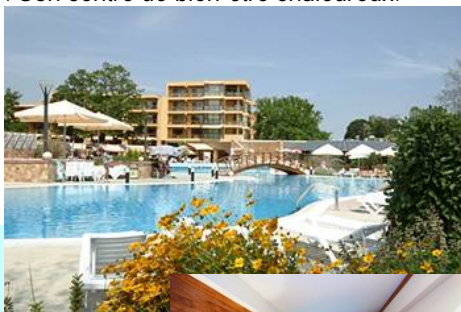
Grandes chambres avec vue sur parc ou sur mer