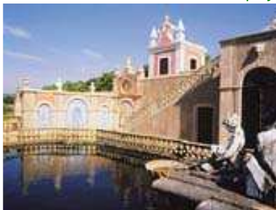
Le Palais d'Estoi, près de Faro

L'Algarve est une région bien différente du reste du Portugal. Son climat est doux en toutes saisons, et justement en avril, comme le dit la chanson le ciel est particulièrement lumineux. Mais il y a aussi le vert des greens de Golf, innombrables et sublimes parcours, et le bleu de ces flots atlantiques qui ont joué ici un rôle si déterminant. Beaucoup de sites à découvrir, des falaises dorées où se nichent les villages de pêcheurs, aux villes médiévales de l'arrière-pays.