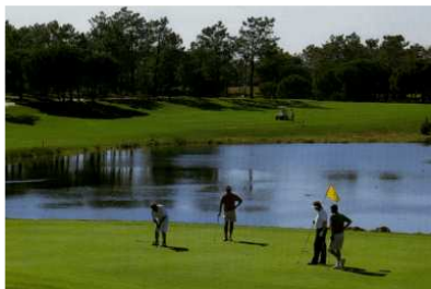
Golf au Ria Formosa