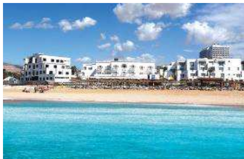
Hôtel Tafoukt Beach