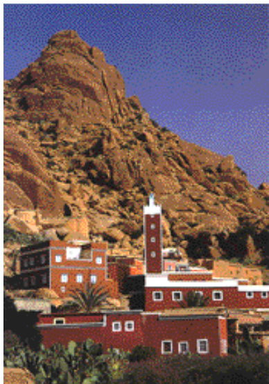
Village de Tiznit, un des buts d'excursion

Cette destination est toujours attirante à cette période de l'année, où la plage immense reste bien souvent très ensoleillée, et où le ciel est d'un bleu limpide qui met en valeur l'ocre rouge de l'architecture traditionnelle marocaine. Depuis cinq ans, les participants de cette Balade reviennent tellement enthousiastes,